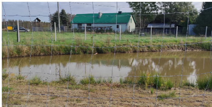
Bezpiecznie ogrodzony staw. W oddali budynek osady myśliwskiej i zabudowy gospodarcze

Łowienie ryb ma niekończący się potencjał, wymaga od nas ciągłego doskonalenia umiejętności, jakim może okazać się rośl karp czy ogromny sum. Jest to pasja, która uczy, wychowuje i napełnia pozytywną energią. Myślistwo jest to sztuka polowania polegająca na tropieniu, podchodzeniu, osaczeniu i zabijaniu lub łowieniu żywcem zwierząt, prowadzona zgodnie z prawem i etyką łowiecką. Dzięki zaangażowaniu Zarządu, członków koła w ostatnim czasie stworzono kilka nowych ambon na trasie. Zapraszamy sympatyków myślistwa, przyrody, zwierząt do wstąpienia w nasze szeregi. Zapraszamy również wszystkich tych, którzy chcieliby miło, czynnie spędzić czas na łonie przyrody, w otoczeniu lasów oraz w towarzystwie przyjaznych myśliwych.